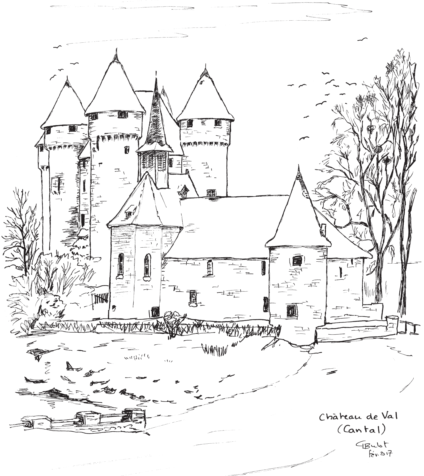
Château de Val (Cantal)